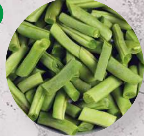
Fazolka lusky řez