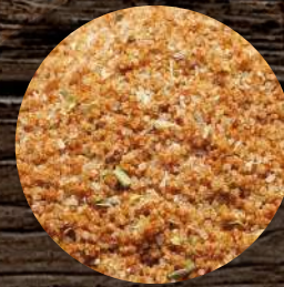
Koření na hranolky