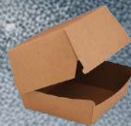
Krabička malá na burger