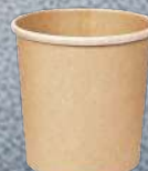
Kelímek kraft - papírový, 500 ml