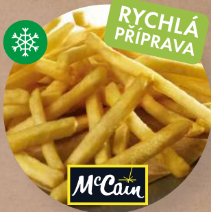
Hranolky Expres Julienne 6 × 6