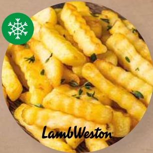
Zig Zag vlnky expres A