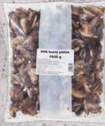
Hřib hnědý plátek 4 - 6 mm