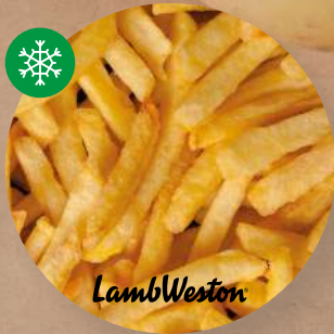
Hranolky Stealth A 6 × 6