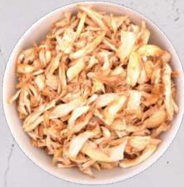
Hliva ústříčná krájená