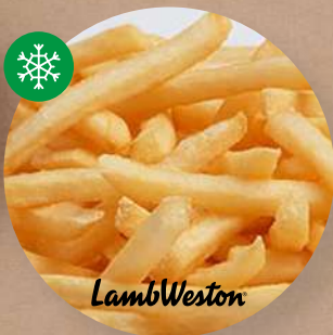
Hranolky Corte Fino 7 × 7