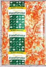
Pod svíčková drť