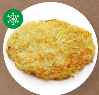
Táborský bramborák 60 g