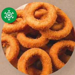
Kroužky cibulové Crispy Onion Rings