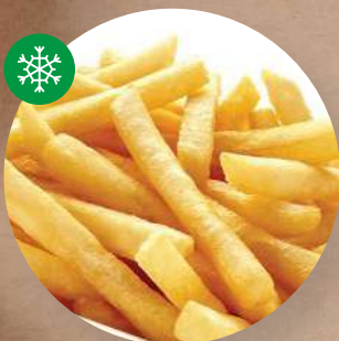
Hranolky Belgie 7 × 7