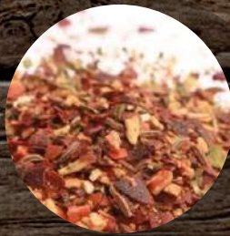
Párty mix dekor