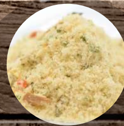
Minutková šňáva kuře