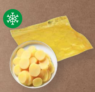
Brambory vařené plátky 6 mm