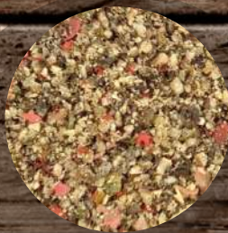
Pepř čtyřbarevný drcený