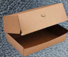
Krabička velká na burger + hranolky