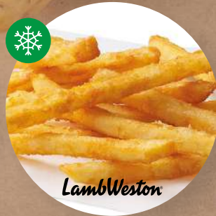
Crispy Fries hranolky Regular 9 × 9 dubaj