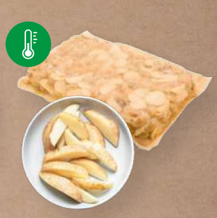
Brambory vařené Měsíčky se slupkou