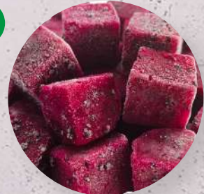
Dračí ovoce červené, 20 mm