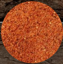
Barbecue - Mexico