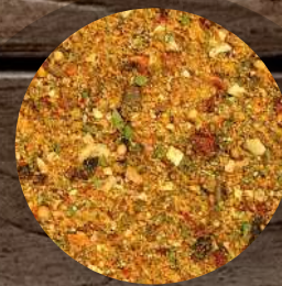
Steak Argentina grill