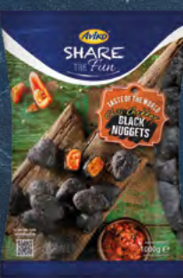
Čedarové černé pikantní nugety 101057 balení: 5 × 1 kg 273 Kč / kg