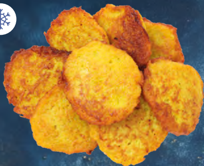
Bramborák před smažený 105003 balení: karton, 20 × 200 g 462 90 Kč / karton