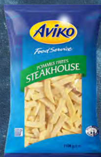
Hranolky typu steakhouse 101077 balení: 5 × 2,5 kg 55 Kč / kg