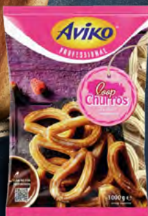
Loops Churros smýčka, 18 g 101081 balení: 4 × 1 kg 119 90 Kč / kg