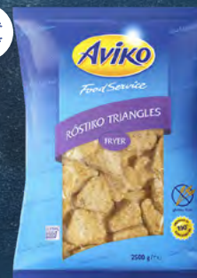
Bramborové rosti trojhránky do fritézy 101078 balení: 5 × 2,5 kg 59 Kč / kg