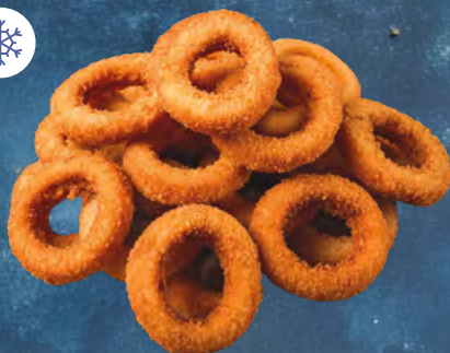
Crispy onion rings (Kroužky cibulové) 101058, balení: 6 × 1 kg 111 Kč / kg