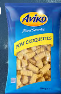
Bramborové krokety válečky 101079 balení: 4 × 2,5 kg 68 Kč / kg